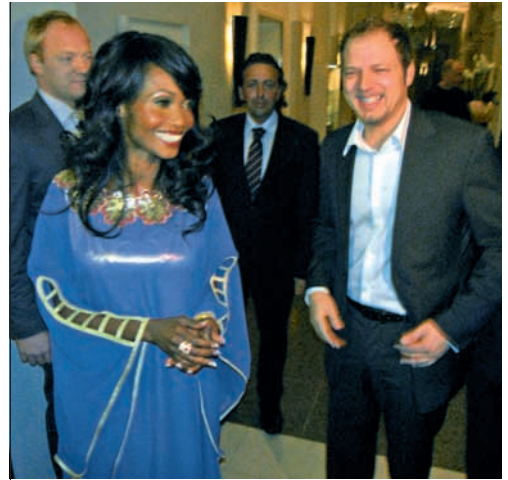
Prinzessin und Comedian: Odette und Super-Mario